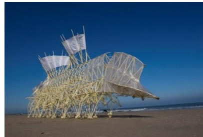
Een strandmonster van Theo Janssen

experimenteren met allerlei materialen om daar beweging in te brengen. Zo werd er een molentje gemaakt van rietjes, met zelf gemaakte zandmachientjes werden schilderijen gemaakt en er werden bewegende dierenfoto's gemaakt. Ook met knex en dominoblokjes werd veel beweging veroorzaakt. De kinderen experimenteerden er op los en ontdekten zo een hele andere kant van kunst.